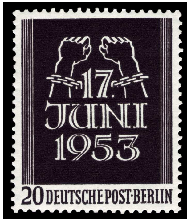
Briefmarke der Deutschen Bundespost Berlin (1953)

Nationaler Gedenktag des deutschen Volkes